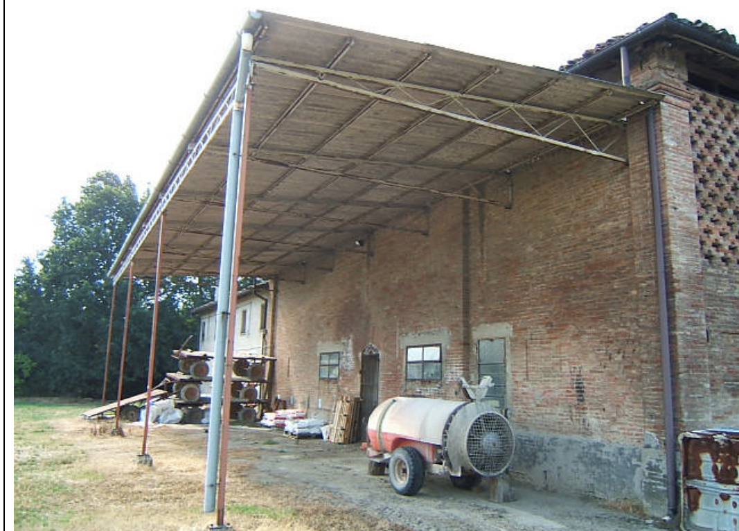
FIN CA 03- tettoia .JPG