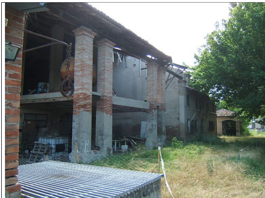
FIN CA 03- edificio .JPG